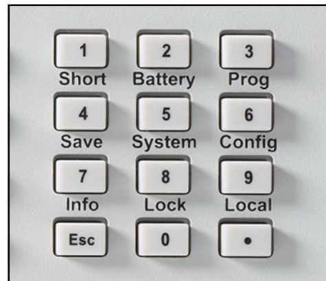
图 1. 使用旋转旋钮或小键盘，使用所有可用的分辨率，迅速输入设置，或设定参数。

Series 2380 可编程 DC 电子负载可以输出各种电压和电流。200W Model 2380-500-15 可以支持最高 500V 或 15A 的电压和电流。250W Model 2380-120-60 可以支持最高 120V 或 60A 的电压或电流。750W Model 2380-500-30 可以支持最高 500V 或 30A 的电压或电流。这些单一输出的独立式电子负载非常经济，均为全内置设备。