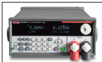
Model 2380-500-15 正面视图，显示了输入端子上的安全保护罩。